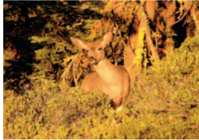
Yosemitein syksyssä voi kohdata muun muassa peuroja.

con kaavoittama Hetch Hetchy -pato Yosemitein kansallispuistossa herätti kiivasta keskustelua, koska patoa suunniteltiin suojeltuun laaksoon. Patoa tuskin olisi rakennettukaan, ellei San Francisco olisi kokenut vuonna 1906 rajua maanjäristystä, joka käänsi päättäjien mielen. Hieman vastaavasti (ja kyseenalaisesti) Los Angeles onnistui kaappaamaan juomakelpoiset vedet Sierra Nevadan itäpuolella sijaitsevasta Owensin laaksosta. Paikasta, jonka aikoinaan useat pioneerit olivat joutuneet ylittämään henkensä kaupalla. Todennäköisesti Kaliforniasta ei olisi kasvanut yhtä tärkeää osavaltiota kuin se nyt on ilman Sierra Nevadan juomavettä. Vesi on kultaakin arvokkaampaa, kuten kalifornialaiset ovat joutuneet viime vuosina toteamaan, kun kuivuus ja siitä seuranneet laajat maastopalot ovat asettaneet Kalifornian ahtaalle. Sierra Nevadaa ei ole nykyivilisäätionkaan unohtaminen. ☺