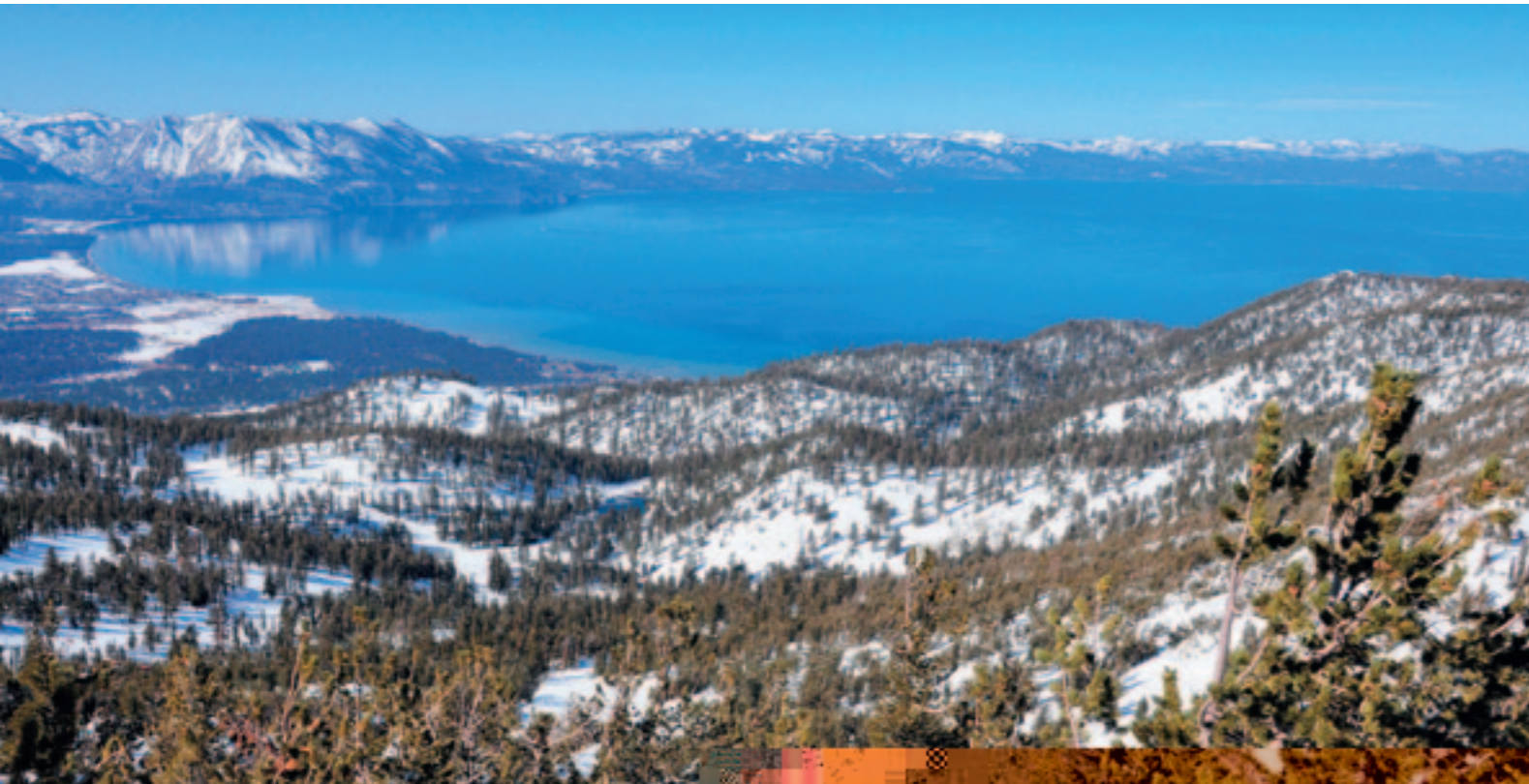
Lake Tahoe nähtynä laskettelukeskus Heavenly'n rinteiltä.